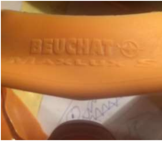
Masque de plongée