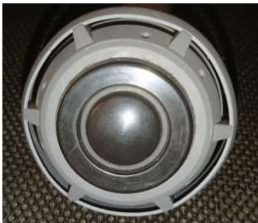
Détendeur d'un masque facial