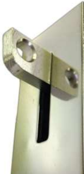
crochet de bassin pour ligne d'eau