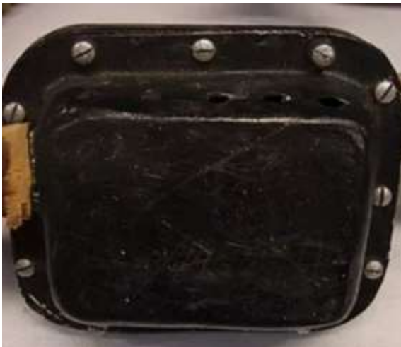
Premier étage du tout 1 er détendeur