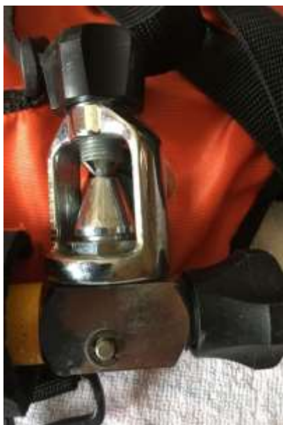
Robinet de Fenzy