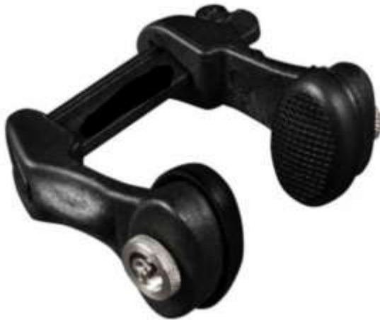
Pince nez pour l'apnée