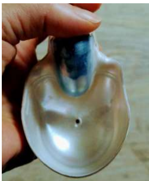
Coquille de Nautilus (vue de face)