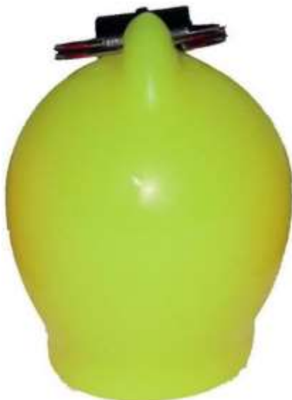
Nez de clown